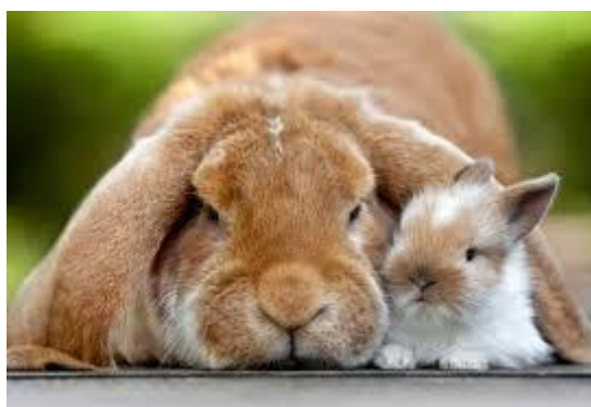
Кролики декоративные, вислоухие.

К посторонним людям мои «вислоушки» относятся недоверчиво. В руки не даются, сразу начинают выпрыгивать и прятаться за диван, а у меня на руках они могут сидеть часами, даже засыпают у меня на груди. Я очень люблю своих домашних питомцев!